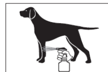
5 Kleiner Sprühstrahl für Pfoten und Hautfalten beim stehenden Tier 6 Für den Kopf die Lösung auf einen Handschuh geben