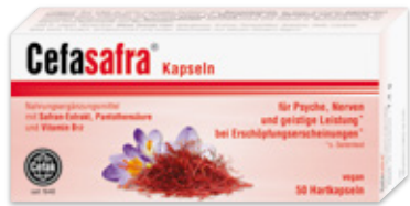
Filmtabletten, Kapseln & Stix