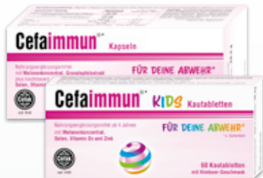
Kapseln, Kautabletten KIDS & Stix