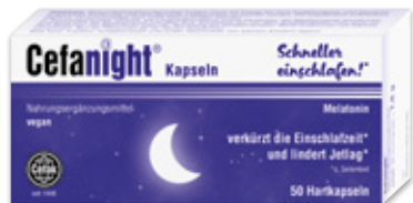
Kapseln, Schmelztabletten, Spray & Stix