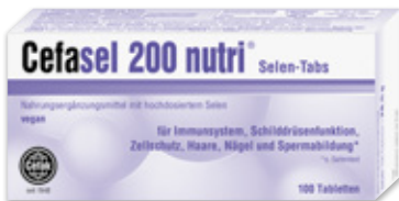
Kapseln, Spray, Stix/Liquid Stix & Tabletten