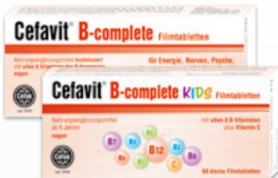
Filmtabletten, Filmtabletten KIDS & Kapseln