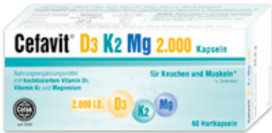
Kapseln & Stix